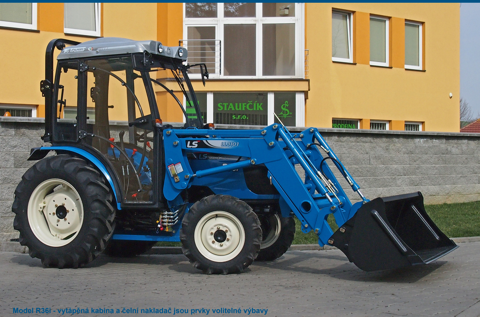
Model R36r - vytápěná kabina a čelní nakladač jsou prvky volitelné výbavy